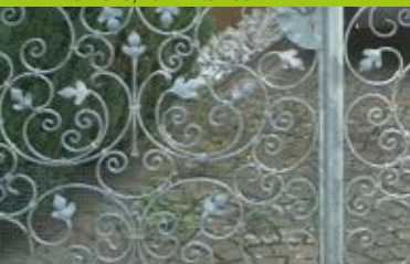
Der rohe, verzinkte Zaun ...