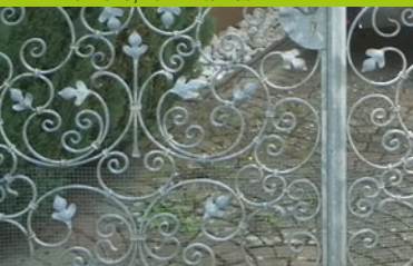
Der rohe, verzinkte Zaun ...